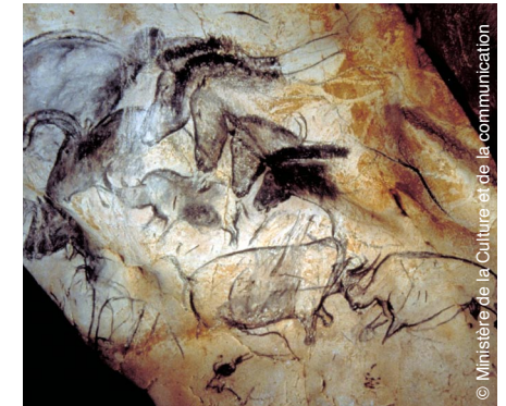
© Ministère de la Culture et de la communication

En nous montrant ces peintures comme si elles avaient été faites hier, en nous emmenant à la rencontre de nos lointains ancêtres, La Grotte des rêves perdus livre une bouleversante réflexion sur l'humanité.