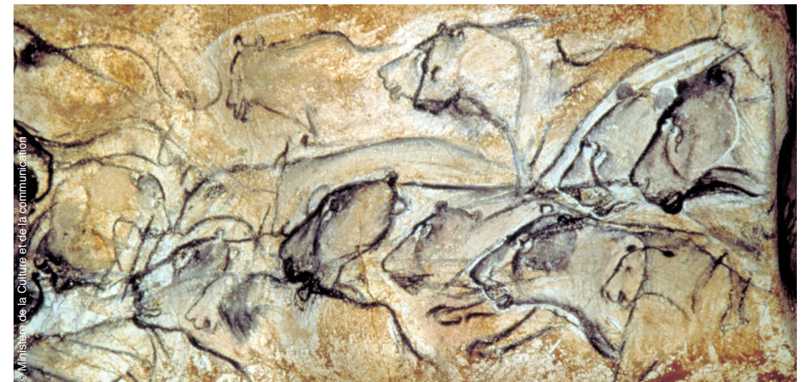
© Ministère de la Culture et de la communication