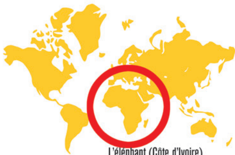
L'éléphant (Côte d'Ivoire)

Dans les animaux cités ci-dessous, il y en a un qui peut rester plus de 5 minutes sous l'eau sans respirer, sauras-tu trouver lequel? Entoure de rouge la bonne réponse.