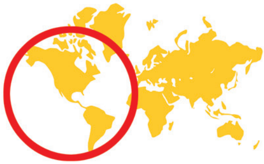
Le jaguar (Brésil)

Parmi ces 6 animaux, sauras-tu retrouver lequel est un des acteurs du film ? Sauras-tu aussi retrouver l'animal qui n'existe que dans les histoires fantastiques, celui dont la légende raconte qu'il peut renaître de ses cendres ?