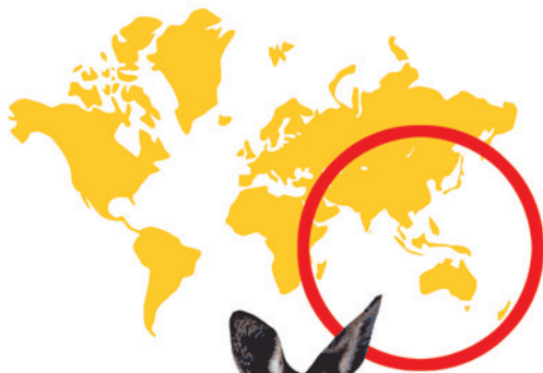
Le kangourou (Australie)

Parmi tous ces animaux plus curieux les uns que les autres, sauras-tu retrouver le héros de notre film?