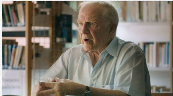
L'échange en classe avec le témoin

avec les documents sources et la démarche d'investigation de l'historien. Avec la disparition des témoins, il sera d'autant plus nécessaire d'apprendre à travailler davantage encore sur ces diverses sources et faire vivre tous les disparus par une approche concrète et sensible de l'histoire de cette période.