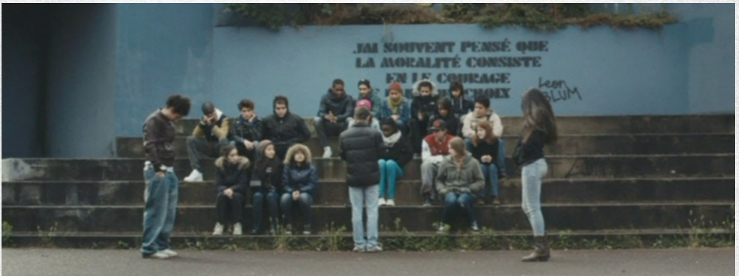
Autonomie et responsabilité : les élèves s'organisent pour fédérer le travail de groupe