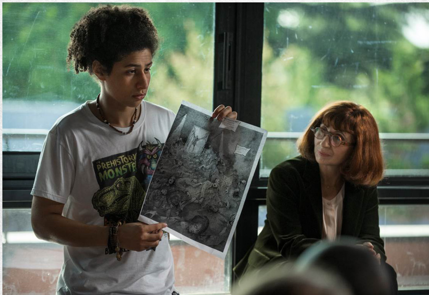
L'élève en situation d'activité effective