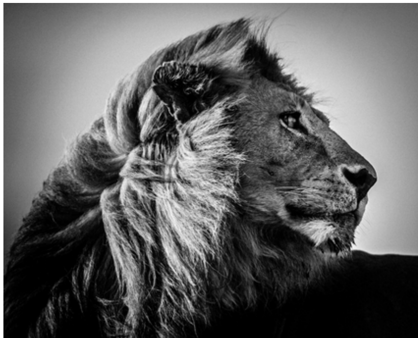
Lion in the wind 3, Laurent Baheux, © Yellowkornor