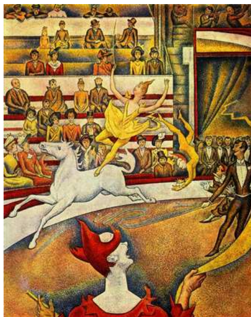
Le cirque, Georges Seurat, 1891