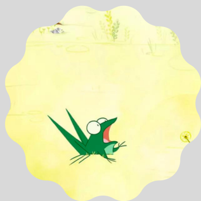
La petite grenouille à grande bouche

"Manger est à la fois ce qui nous rassemble et nous différencie. La cuisine est à la fois une pratique quotidienne et un art. Chaque continent, chaque pays, chaque région, chaque ville, et même parfois chaque famille, détiennent leur spécialité culinaire. Pas étonnant de voir La Chouette du cinéma rassembler des histoires autour de cette culture". Arnaud Demuynck