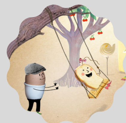
Dame tartine aux fruits