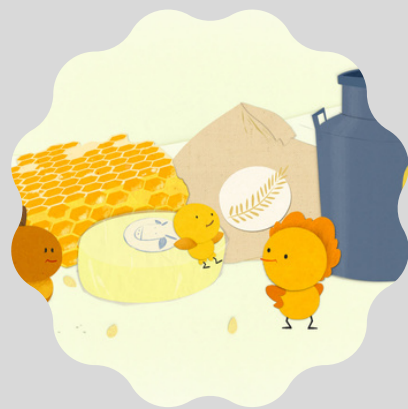
Le petit poussin roux