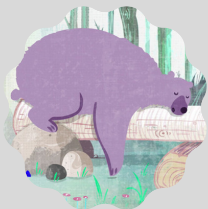
L'Ours qui avale une mouche